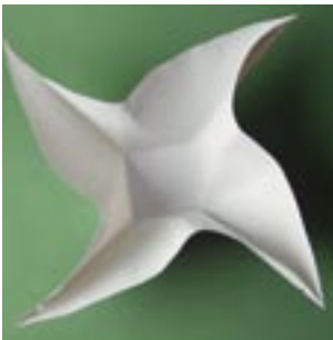
Illustration 1 og 2.

Start med at forbukke foldelinien fra hjørnespids og hen mod midten til du rammer foldelinien der danner bun- den. Dette gentages i alle hjørner.